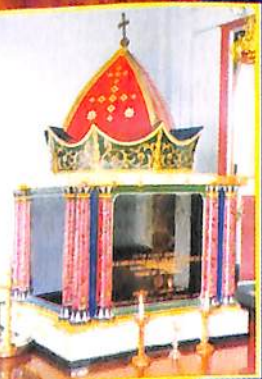
വള്ളിക്കാട്ടു ബാവായുടെ കബറിടം

പ. ബസേലിയോസ് ഗിവർഗീസ് പ്രഥമൻ കാതോലിക്കാ ബാവായുടെ 75-ാം ഓർമ്മപ്പെരുന്നാൾ, 2003 ഡിസം. 16, 17 തീയതികളിൽ വാകത്താനം വള്ളിക്കാട്ട് ദയനായിൽ